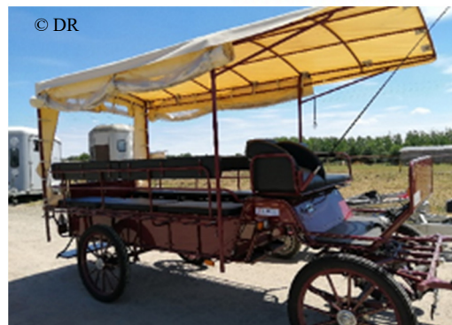
Le programme précédent a bénéficié aux Attelages de l'Erdre pour des balades en calèche accessibles à tous.